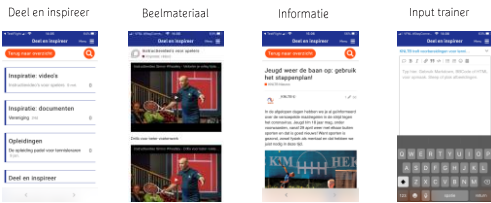
17 Leraren App