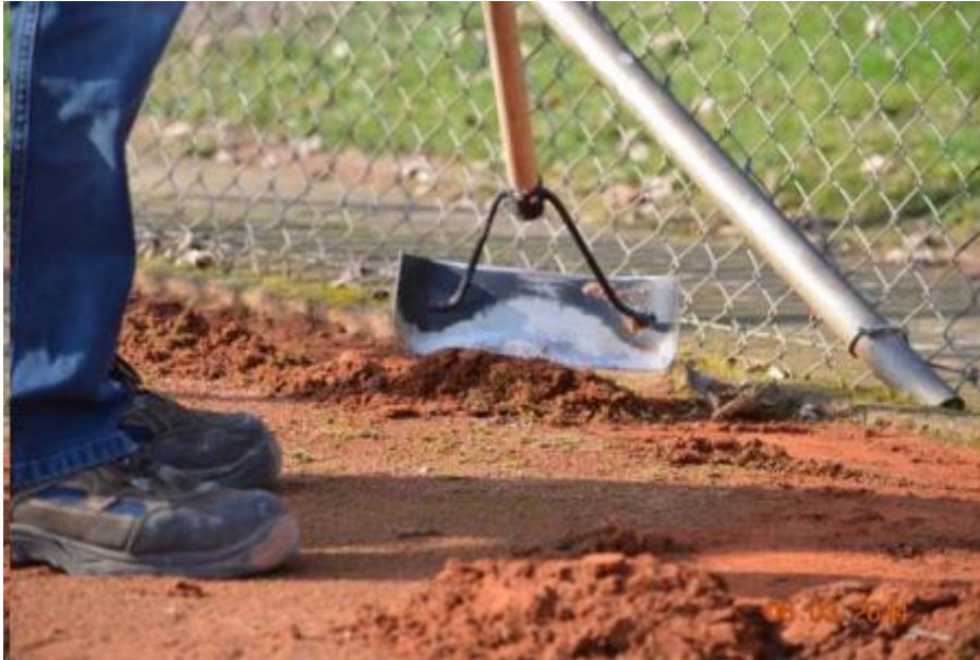
Figuur 3: kantschraper

pakking. Na nogmaals wat water op te brengen kan de plek 'gesmeerd' worden; het uitvlakken van de laag. Het advies is om vervolgens de plek onder natuurlijke omstandigheden te laten uitharden en ligt af te strooien met nieuw gravel. Vul nooit de gaten met het grove gravel dat op het baanoppervlak ligt!