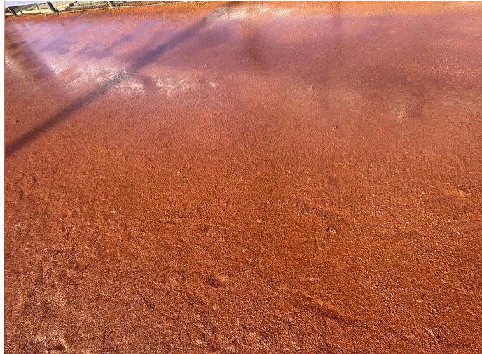
Figuur 4: voorbeeld van opdooi

Wanneer het gravel bevroren is en de dooi intreedt, spreekt men van opdooi. Het gesmolten water kan niet door het gravel afgevoerd worden. Naar de zijkant afvoeren is lastig doordat het gravel niet meer stabiel is. Het gravel wordt 'papierig', waarbij de kans op schade bij betreding groot is (zie Figuur 4 ). Om deze redenen kan de baan tijdens de periode van opdooi niet worden gebruikt. Om de baan weer bespeelbaar te krijgen is aanvullend onderhoud na een periode van opdooi noodzakelijk.