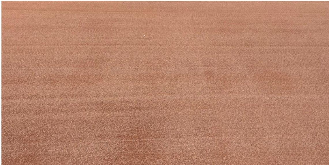
Figuur 4: gravel op verharding tennisbaan met natuursteen

NB: Momenteel loopt er een pilot met een ander type infillmateriaal ( Figuur 4 ). Deze is in fractie grover en slijtvaster (harder), waardoor verbrijzeling minder snel optreedt en dit mogelijk ten goede komt aan het openhouden van de toplaag ten behoeve van de waterdoorlaatbaarheid. Aan de andere kant moet dit ook niet te veel ten koste gaan van grip en slijtage van de mat. Deze ontwikkeling wordt nauwlettend gevolgd.