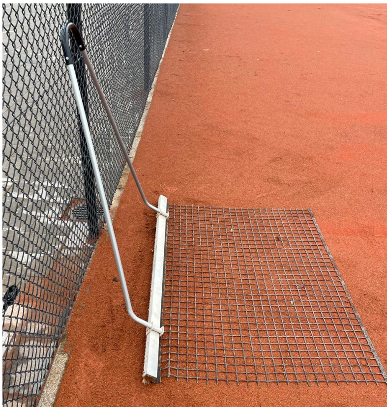
Figuur 6: borstel met sleepnet

De baan dient na gebruik te worden geslept. Let op dat er geen vervuiling van buiten de baan naar binnen wordt geslept. De voorkeur gaat hierbij uit naar een bezem met daarachter een sleepnet ( Figuur 6 ). Ook onder nattere condities dient de baan geslept te worden. In de haren van de bezem blijft vervuiling zitten, advies is om de bezems dan ook frequent schoon te maken. Het sleepschema is cirkelvormig van buiten naar binnen.