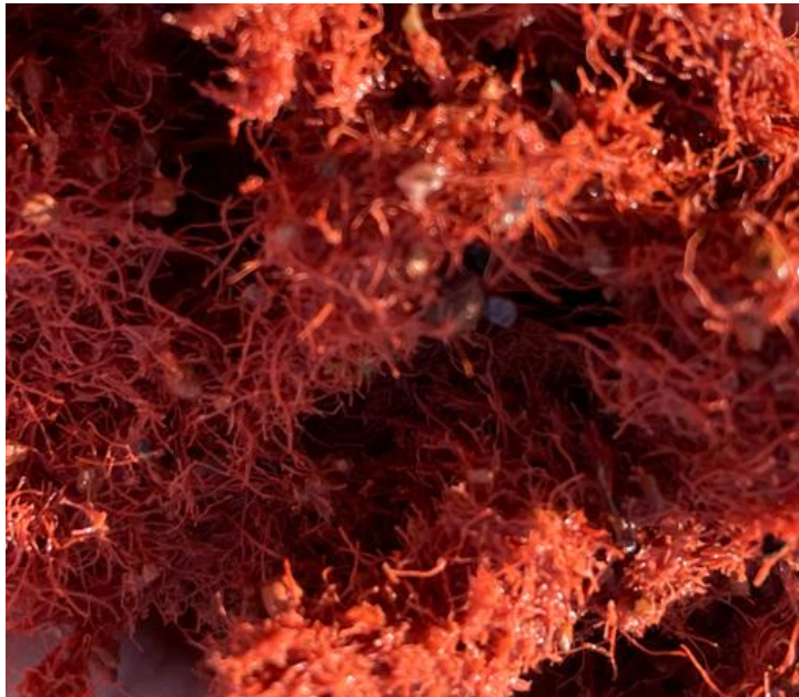
Figuur 2: fijne vervuiling

Vervuiling is feitelijk alles wat niet in de mat of op het gravel thuishoort. Hierbij valt te denken aan: Algen- en mossen, takken, bladeren en zaden van bomen, onkruid, uitwerpselen van dieren, maar ook slijtsel van de toplaag en tennisballen, afval van tennissers ( Figuur 2 ).