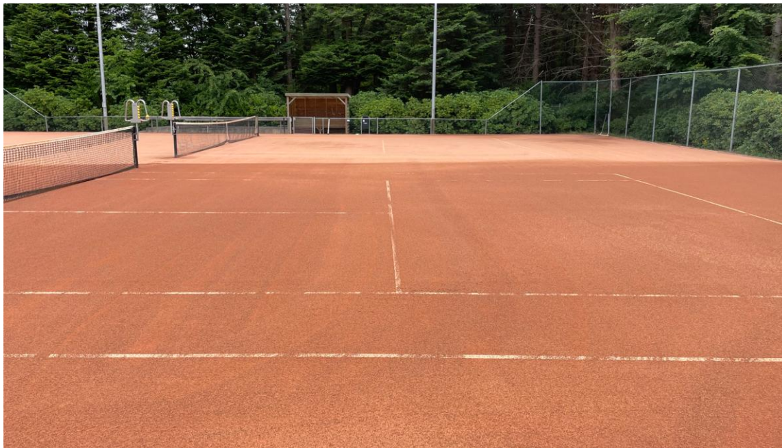
Figuur 1: mogelijkheid tot beregening per baan

Het verdient de voorkeur om de baan met deze ondergrond op maat te kunnen sproeien ( Figuur 1 ). De ligging van de baan (periodes van zon en schaduw) is sterk van invloed op de behoefte aan extra beregening.