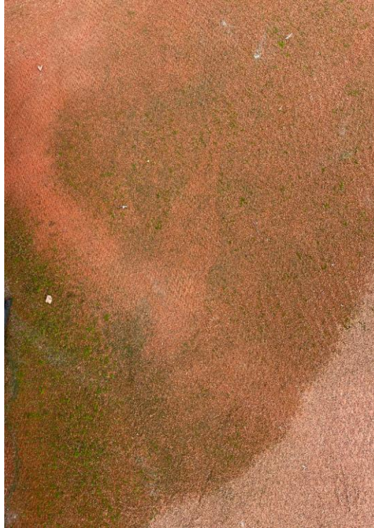
Figuur 3: algvorming

De grootste uitdaging voor een gravel op verharding baan is een verslechterde afwatering/verstopping van de baan door vervuiling in combinatie met de verbrijzeling van het infillmateriaal door het bespelen van de baan. Het is dus zaak om de baan zo lang mogelijk open (van structuur) en schoon te houden. Bij onvoldoende of onjuist onderhoud kan de baan snel verstopt raken met als gevolg een beperking in bespeelbaarheid. Ervaring leert dat deze baansoort bij gemiddeld 2 à 3 jaar tegen een kritische grens aanloopt als het gaat om de waterdoorlaatbaarheid en dat specialistische onderhoudswerkzaamheden nodig zijn. Hierbij is wederom de ligging van de baan een belangrijke en bepalende factor.